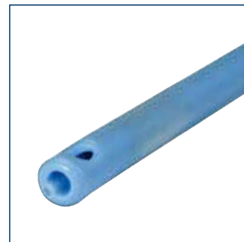
Zentral offene Spitze, integral Ballon