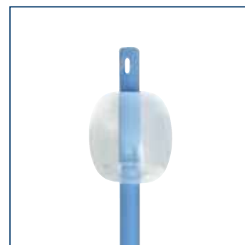
Ballonvolumen: 05-10 ml