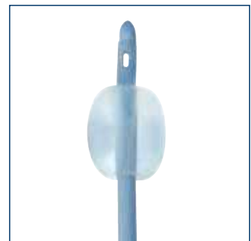
Ballonvolumen: 05-10 ml